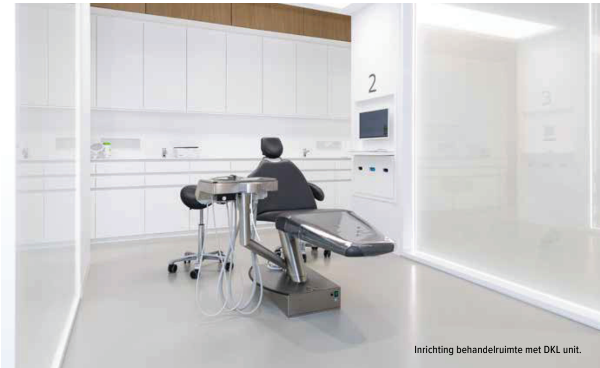
Inrichting behandelruimte met DKL unit.